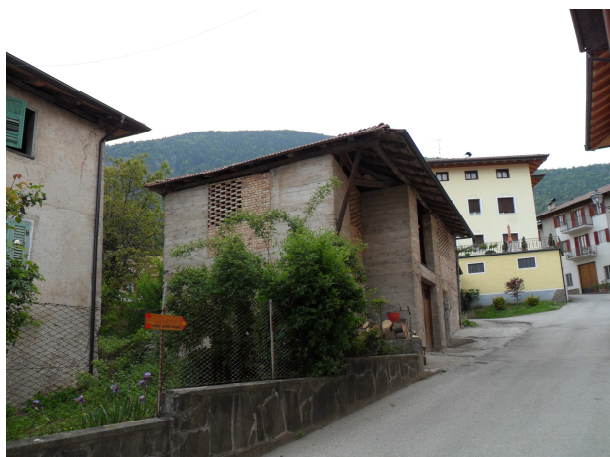
VISTA DA EST