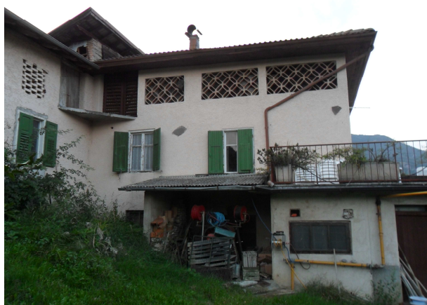
VISTA DA SUD-EST