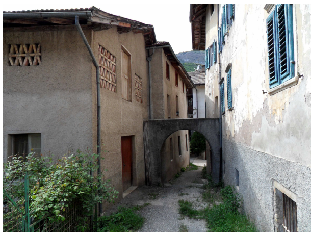
VISTA DA EST