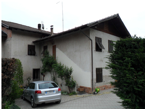
VISTA DA NORD-OVEST