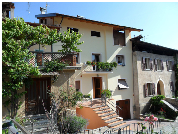
VISTA DA SUD-OVEST