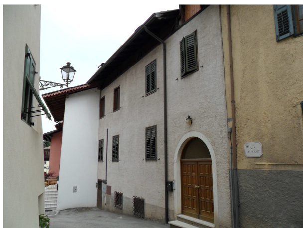
VISTA DA OVEST