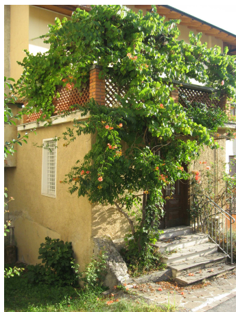
VISTA DA SUD-OVEST