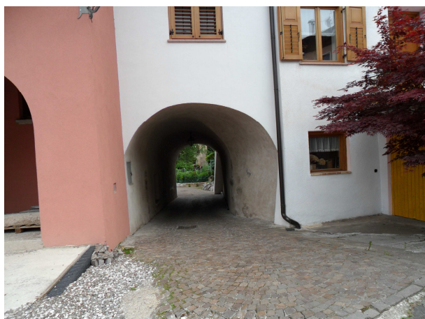
DETTAGLIO PASSAGGIO A VOLTA A BOTTE