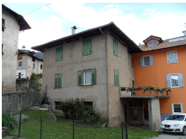
VISTA DA SUD-EST