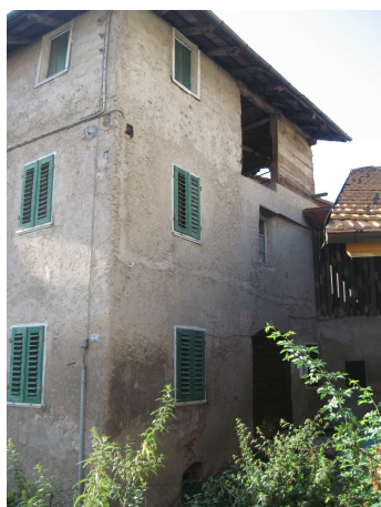
VISTA DA OVEST