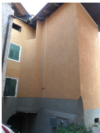
VISTA DA SUD-OVEST