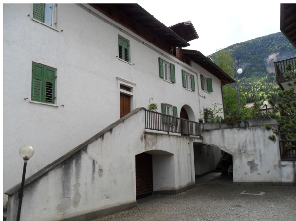
VISTA DA NORD-EST