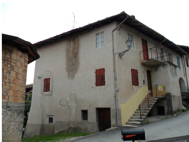
VISTA DA NORD-OVEST