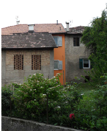
VISTA DA NORD