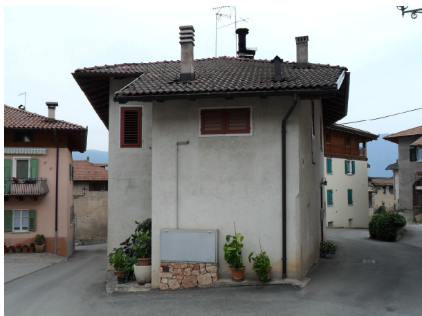
VISTA DA OVEST