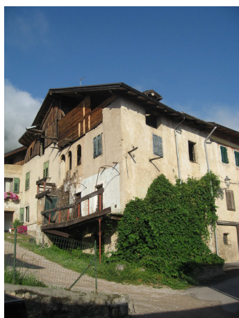
VISTA DA SUD-EST