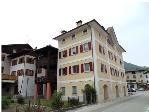
VISTA DA SUD-EST