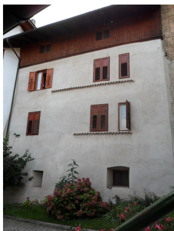
VISTA DA NORD-EST