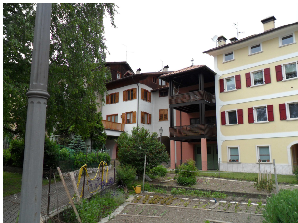
VISTA DA SUD-EST