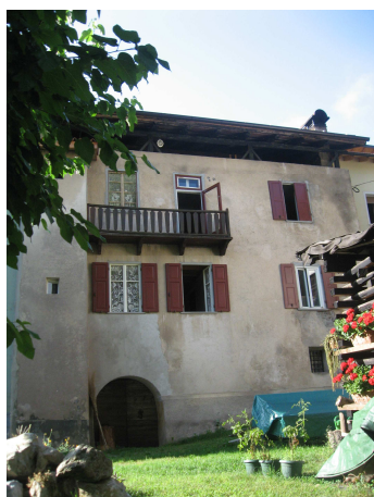
VISTA DA NORD