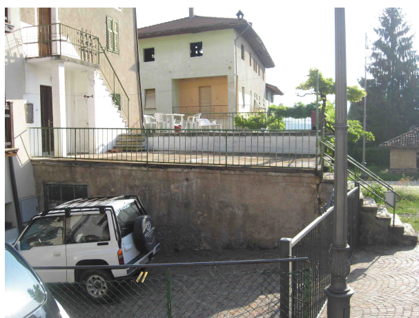
VISTA DA OVEST