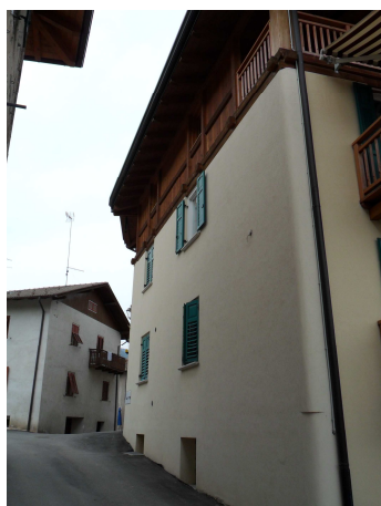
VISTA DA SUD-OVEST