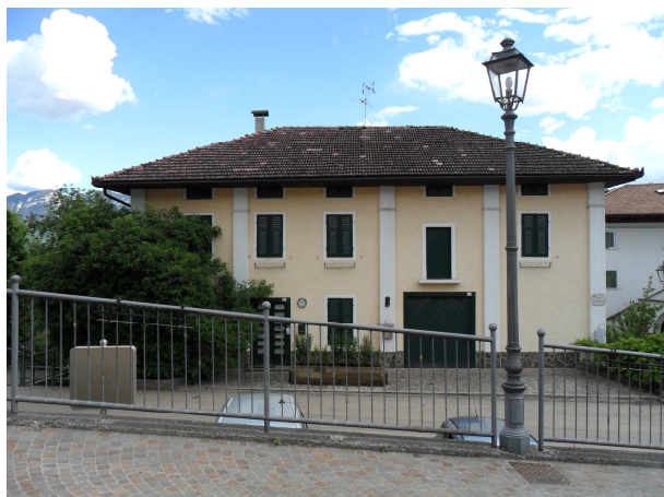
VISTA DA NORD-OVEST