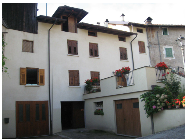
VISTA DA NORD-EST