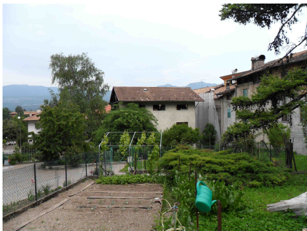
VISTA DA OVEST