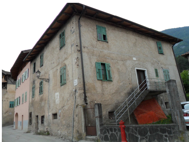
VISTA DA NORD-EST