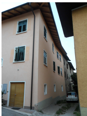
VISTA DA SUD-EST