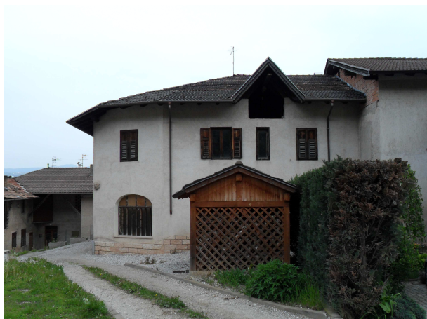
VISTA DA OVEST